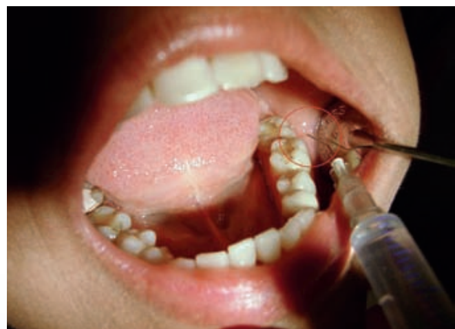
■ Injekciós kezelés

A szájüregi akupunktúrának az a megfigyelés az alapja, hogy a különböző betegségek és szervi zavarok következtében a szájüregben szabályszerűen meghatározott, körülírt területeken nyomásérzékeny pontok jelennek meg. Célzott kezeléssel az ilyen területek nyomásér-