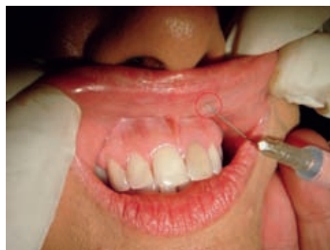
■ Bal felső nagy metszőfog pontja

A szervezetből, a funkciós körökből érkező zavaró jelek az akupunktúrás pontokba mint helyi izgalmi állapotok jelentkeznek. A cél az adott helyen megbomlott bioelektromos, bio-